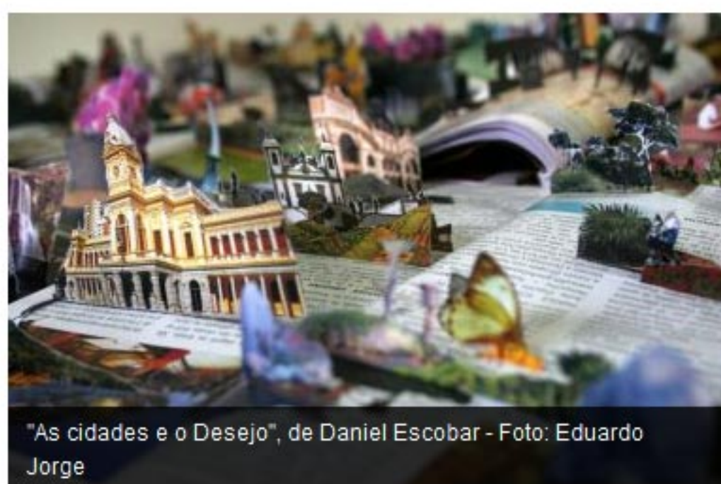
"As cidades e o Desejo", de Daniel Escobar

Lugares/Representações é a exposição que reúne 14 obras dos artistas Andrei Thomaz, Daniel Escobar e Marina Camargo, ganhadores do Prêmio Funarte de Arte Contemporânea. Na mostra, em cartaz até 24 de abril, no Complexo Cultural Funarte São Paulo, os artistas apresentam projetos conjuntos e individuais – todos com temas relacionados às cidades e às diferentes formas de